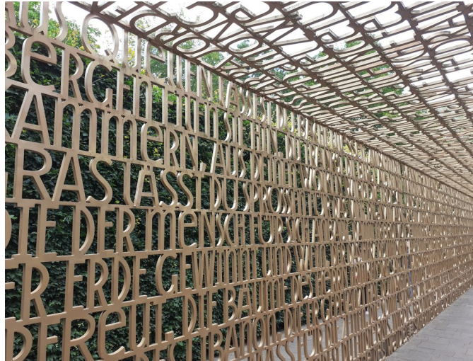
Gottes Wort—Gärten der Welt, Berlin—Foto: Habel

Bitte melden Sie sich kurz per Mail unter michael.habel@bistum-hildesheim.net